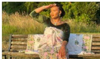
Les habits que portent cette femme, ce sont des salouvas. Les salouvas c'est des vêtements traditionnels portés par les femmes à Mayotte, aux Comores et certaines régions à Madagascar