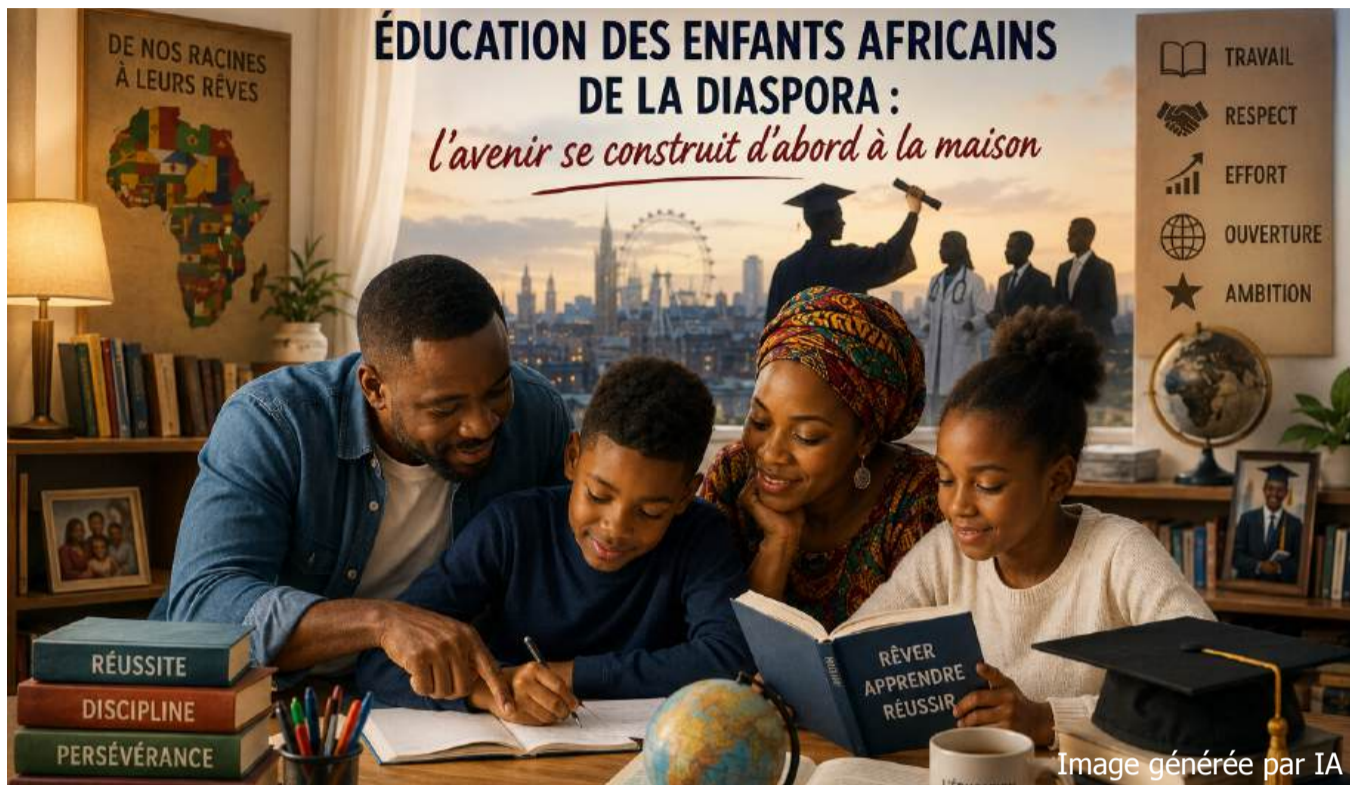
Image générée par IA

I l suffit d'assister à une remise de diplômes dans une université européenne pour mesurer le chemin parcouru par de nombreux enfants issus de l'immigration africaine. Parmi les futurs médecins, ingénieurs, chercheurs, avocats ou entrepreneurs figurent désormais des jeunes dont les parents ont quitté Dakar, Bamako, Abidjan, Kinshasa, Yaoundé ou Conakry avec un seul bagage : l'espoir d'offrir à leurs enfants une vie meilleure.